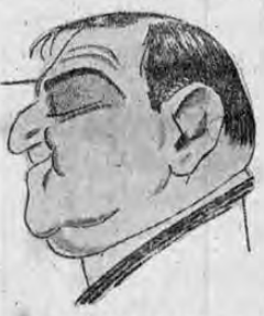
FIGUEROA LA GUARDIA